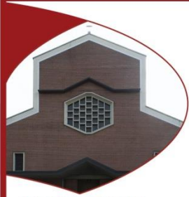
PARROCCHIA S. GIOVANNI B. ALLA BICOCCA