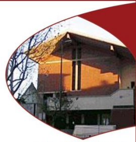
PARROCCHIA GESÙ DIVINO LAVORATORE

Informatore Settimanale del 4 gennaio 2026